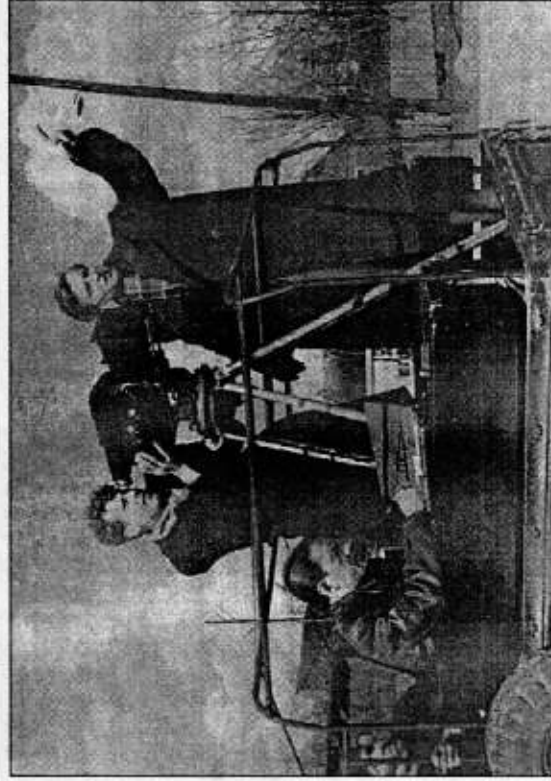
Pirmojo kino filmavimo Šiauliuose metu.